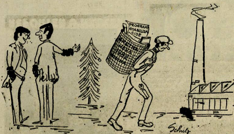
- Čuj, kakav je ovo novi Djed Mraz ...