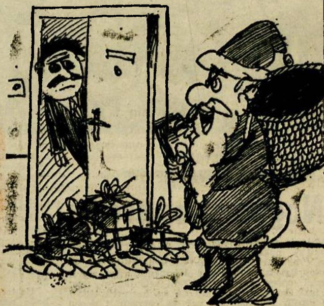
- Dakle, imali ste: tri velika paketića i dva mala, svega ...