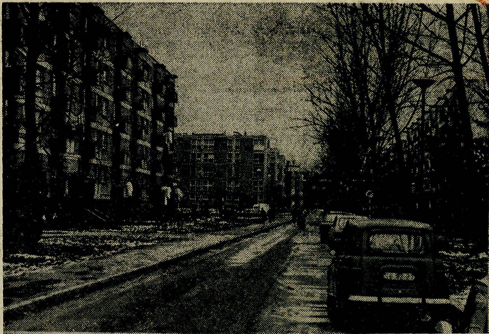
Naselje bez tržnice, javne govornice, servisa, prodavaonice kruha ...